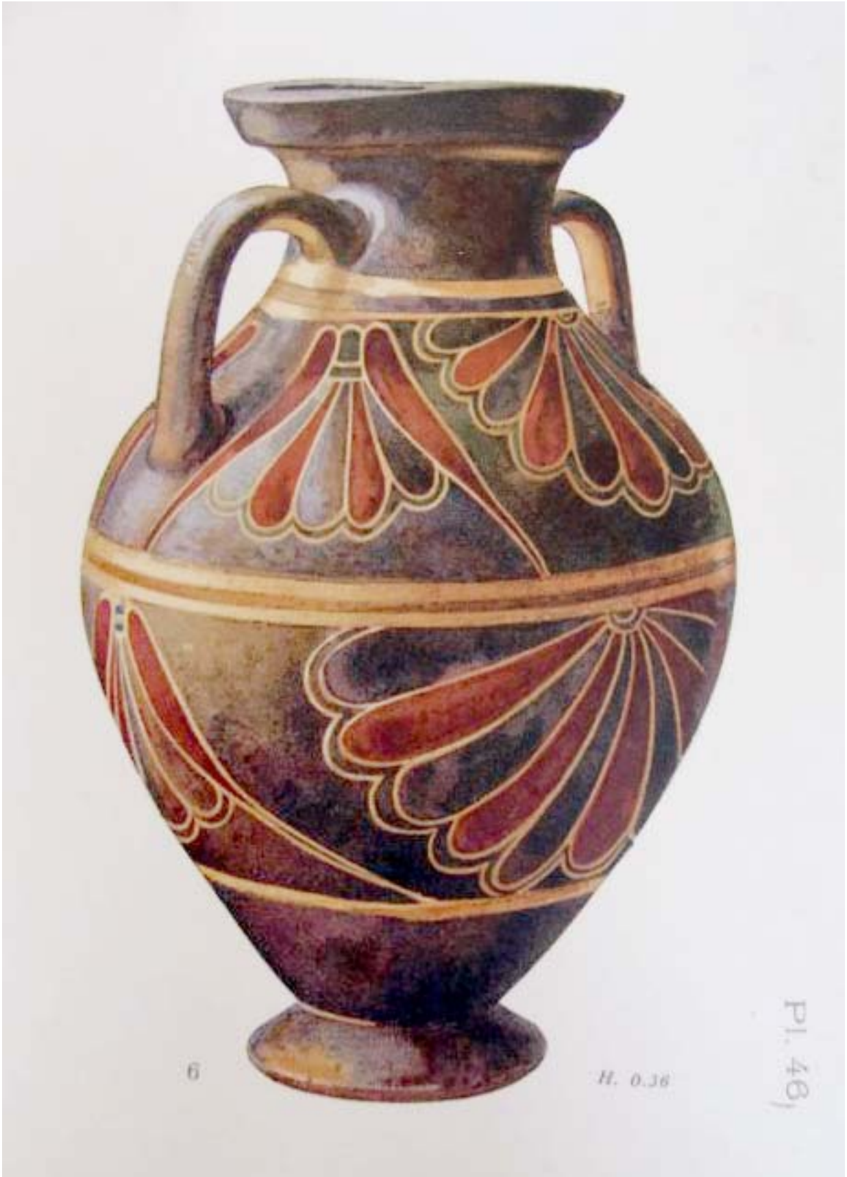
Kinch: Vroulia, p. 46, 6.